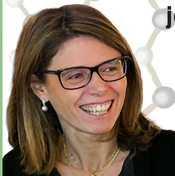
Professor, University of Padova, Italy

Back and forth from structure to function: the long journey around non-canonical nucleic acids arrangements