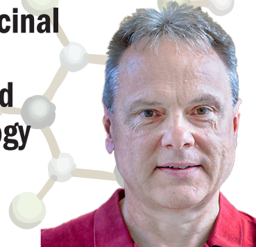
Professor, Charles University, Czech Republic

Chemical modifications of nucleotides and nucleic acids for medicinal chemistry, bioanalysis and chemical biology